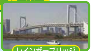
レインボーブリッジ