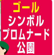
ゴールシンボルプロムナード公園